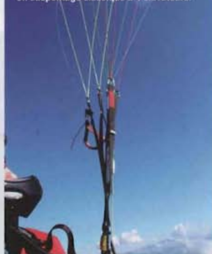
TABLEAU RÉCAPITULATIF DES MESURES PARAPENTE+