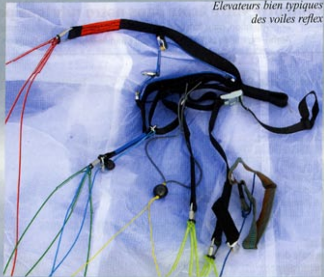
Elevateurs bien typiques des voiles reflex

Rapide à prendre en charge, elle décolle en quelques pas. Elle est très bien pour les pilotes fainéants qui lèvent les pieds trop tôt car la Moscito pardonne beaucoup !