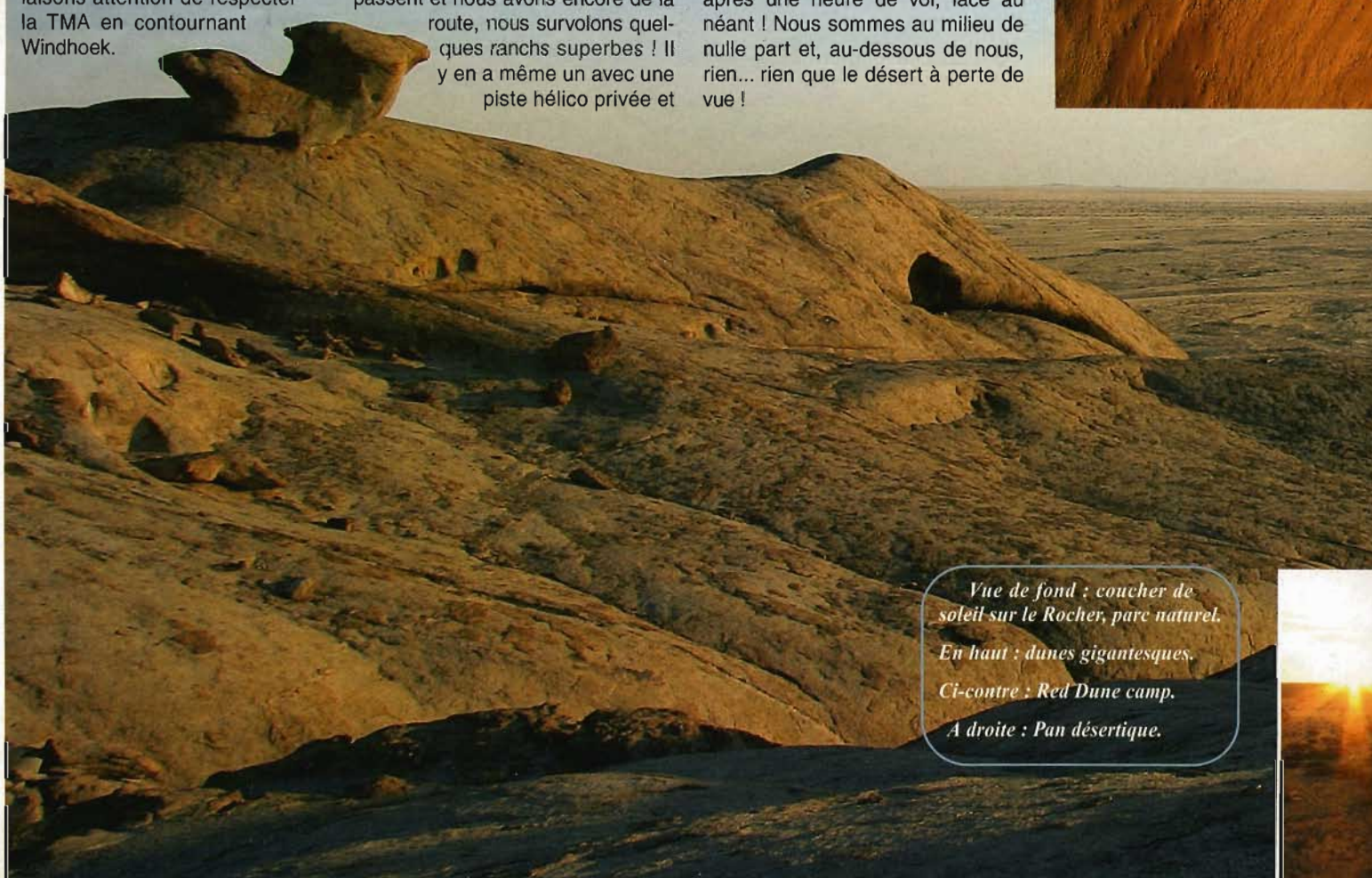
Vue de fond : coucher de soleil sur le Rocher, parc naturel. En haut : dunes gigantesques. Ci-contre : Red Dune camp. A droite : Pan désertique.